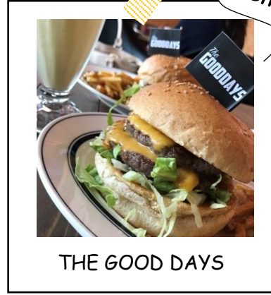
THE GOOD DAYS

#サンメッセ日南 #モアイ像 #絶景 #運氣上昇するかも♪ 住所 宮崎県日南市大字宮浦2650 電話 0987-29-1900 (サンメッセ日南)