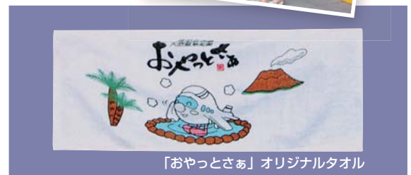
「おやっとさあ」オリジナルタオル